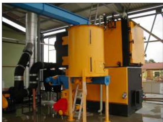
• Instalovaný kotel - TSP 100 ve firmě DĚVŇÍ EVOSPOL Zaho í.

Zahrnuje kompletní za ízení kotelny, vyžadující pouze ob asný dozor.