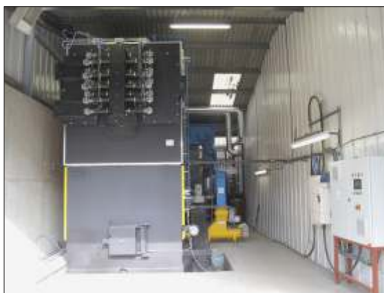
• Kotelna 2,5 MW -s automatickým ištním vým níku.

St žejní prvek kompletu, je automatický ty tahový kotel se šamotovou vyzdívkou, typ TSP. Palivo nutné pro bezporuchový provoz je dřevní odpad do velikosti 3 x 3 cm (piliny, hobliny, št pky z drti e) a vlhkosti do 60%. Sou ástí kotle, který je vyvinutý s vysokou funk ní bezpe ností provozu, je mechanické nebo hydraulické dávkování paliva do kotle s elektrickým pohonem dopravníku. Dalšími sou ástmi jsou hasící jednotka s termickým idlem, pojistný protipožární ventil, tahové