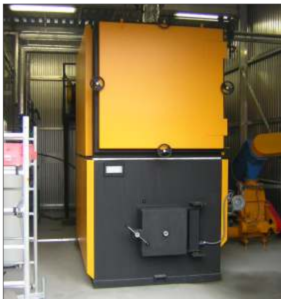
• Instalovaný kotel - TSP 35 ve firmě SOMERLAP (Anglie - msto Mark)

POZOR - nov otev ený E-SHOP na www.elbh.cz